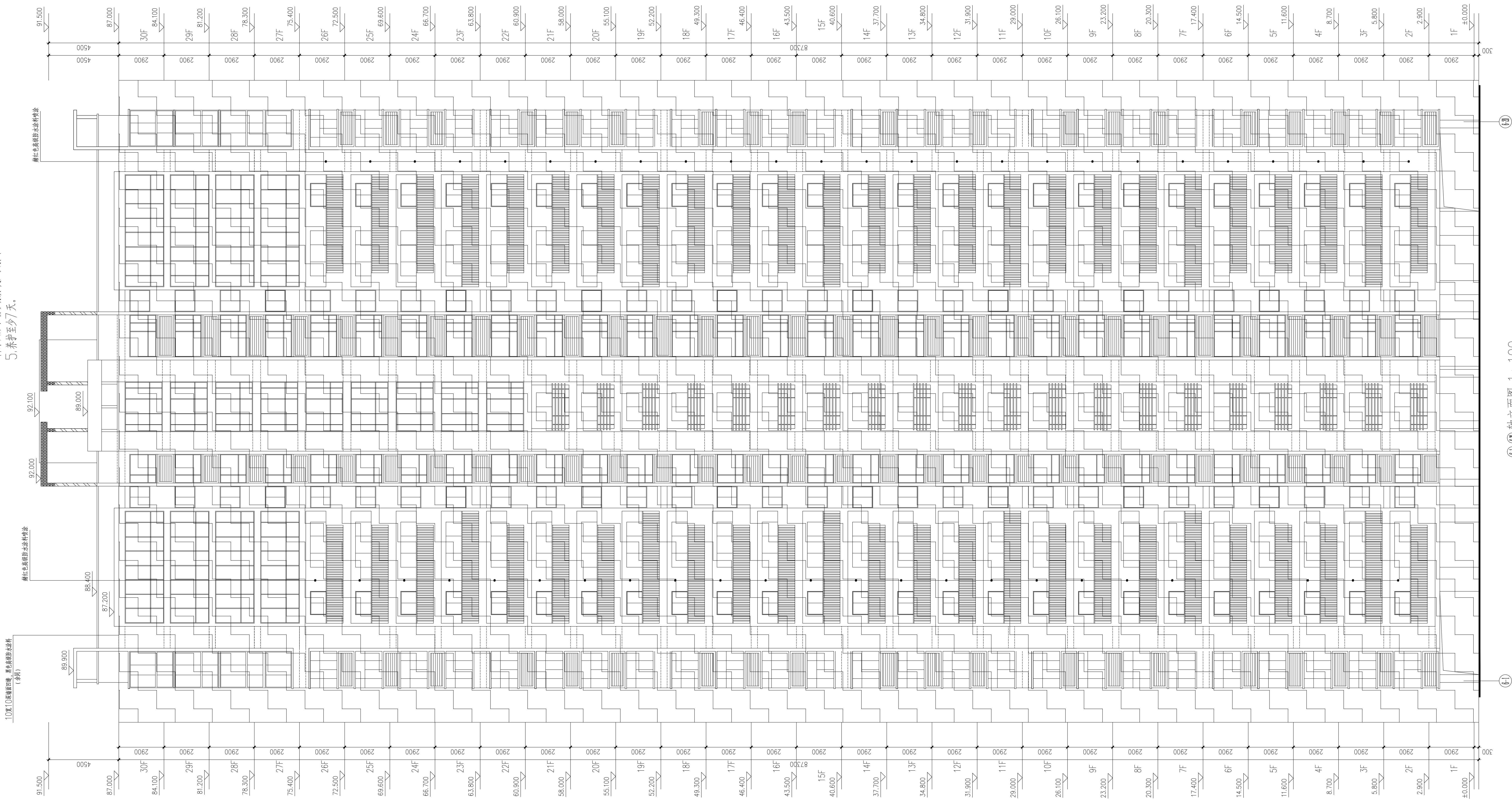
6-1-6 轴立面图 1:100