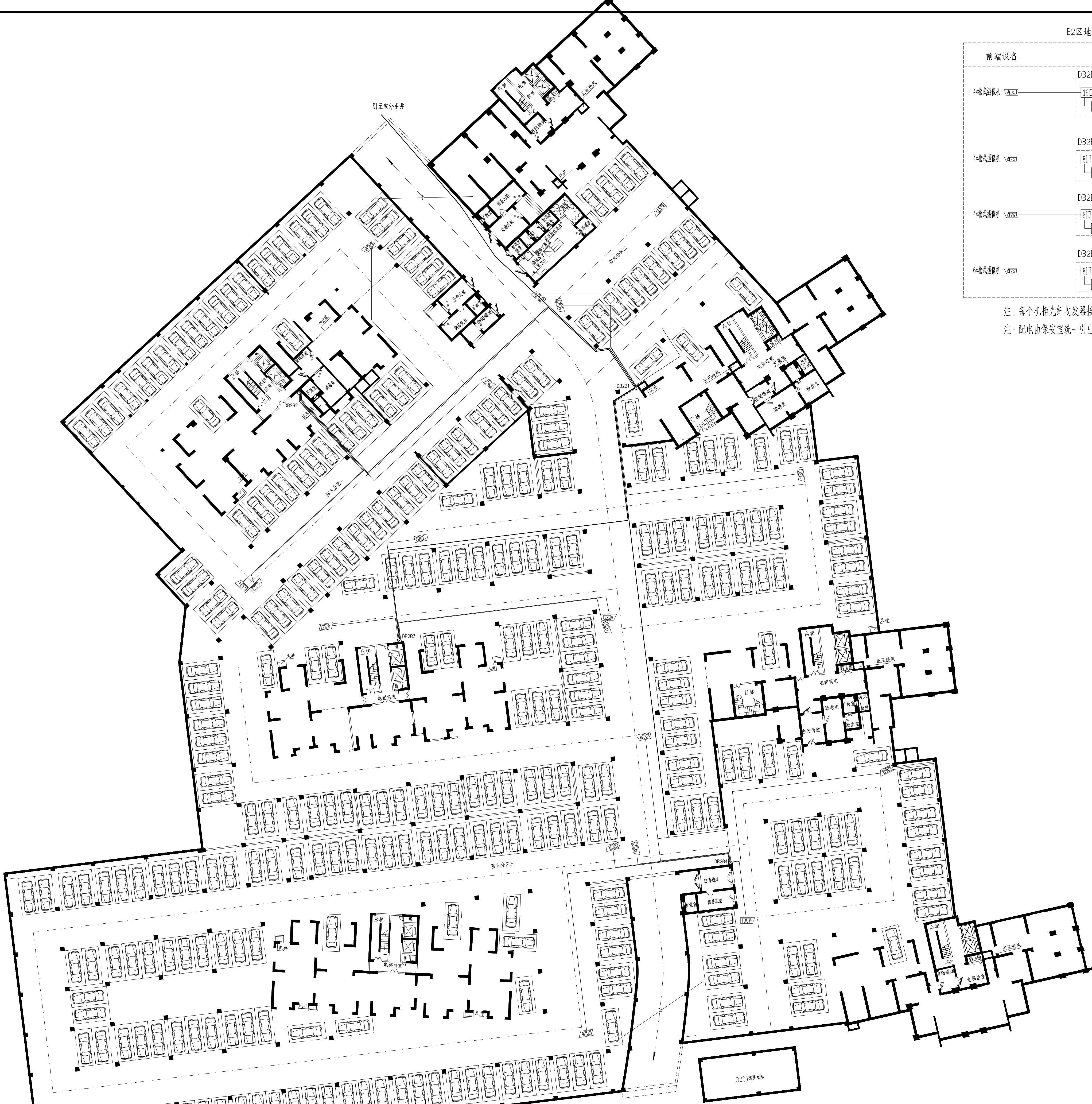
B2区地下室监控平面图 1:300